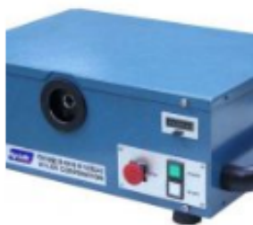
EZY MAT 5 Auto Swaging Machine