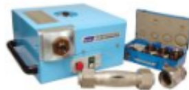
EZY MAT 2 pre-Swaging & Flaring Machine