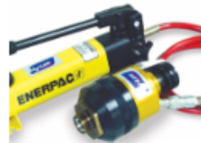
EZY-MAT I Pre-Assembly Machine

Das hydraulische Vormontagesystem der Hy-Lok Corporation ist ausgelegt für die Verwendung mit allen Hy-Lok Klemmringverschraubungen der Größen 1/2" bis 2" (12mm bis 38mm).